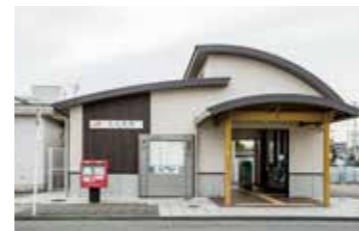
JR下土狩駅 / 徒歩 8分