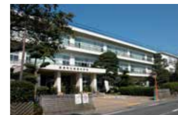
長泉中学校 / 徒歩 4分