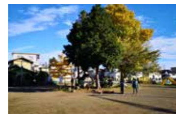
山神社 / 徒歩 1分