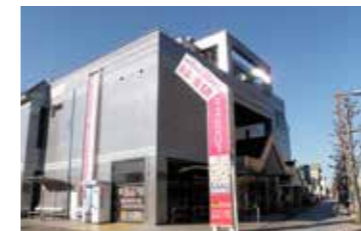
マックスバリュエクスプレス / 徒歩 6分