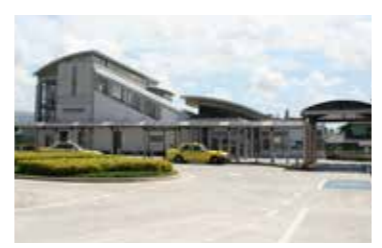
JR 長泉なめり駅 / 徒歩 13分