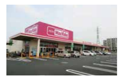
マックスバリュ / 徒歩 6分