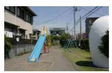
惣ヶ原公園 / 徒歩 2分