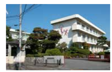
長泉小学校 / 徒歩 7分