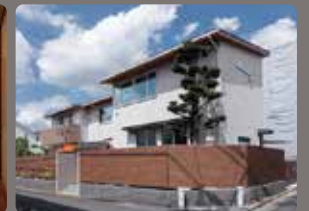
先行して竣工したご自宅。囲炉裏の間や庭と調和する外観などこだわりを叶えた。