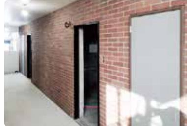
共用廊下の壁もタイル仕上げで、高級感アップ

質感豊かなレンガ調タイルを贅沢に使用したことで、周辺物件と一線を画す風格漂う佇まいを実現しました。ひと目で入居者様の心を掴む外観デザインにより、独自の付加価値を生み出しています。