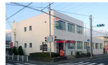
葦山郵便局 / 徒歩 2分