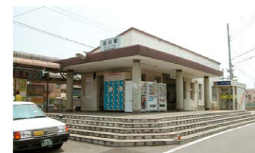
葦山駅 / 徒歩 9分