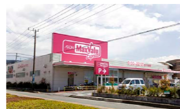
マックスバリュ / 徒歩 1分