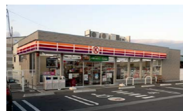
サークルK / 徒歩 9分