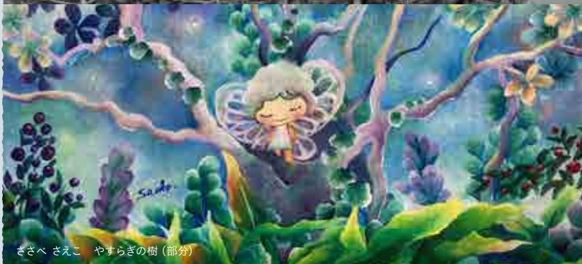
ささべ さえこ やすらぎの樹 (部分)