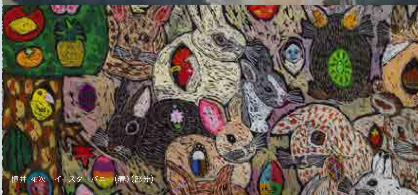
横井 祐次 イースターバニー (春) (部分)