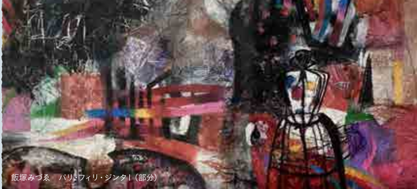
飯塚みづゑ パリ・フィリ・ジントI (部分)