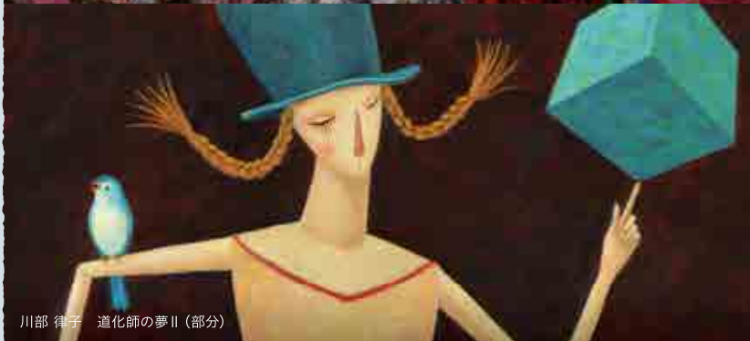
川部 律子 道化師の夢II (部分)