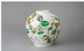
【色絵山法師文飾壺】

1987 東京藝術大学大学院美術研究科陶芸専攻 修了 日本伝統工芸展 入選、東日本伝統工芸展 入選 現在 神奈川県鎌倉市にて作陶 日本工芸会正会員 個展:日本橋三越本店、瑞玉ギャラリー、ギャラリーおかりや等