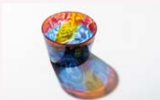
【イマジナリーフレンド】

1990 多摩美術大学大学院 美術研究科デザイン専攻ガラスコース 修了 1994 世界現代ガラス展World Glass Now'94招待作家 2007~東京都江東区にてシェア工房主宰 2019~多摩美術大学工芸学科ガラスプログラム非常勤講師 個展:サボア・ヴィーブル 横浜高島屋美術画廊 エクリュ+HM 東京妙案ギャラリー 等