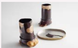
【獣たちにも長翳を】

1992 東京藝術大学大学院美術研究科鍛金専攻 修了 1992~栃木県日光市にて制作活動を始める 2002~千葉県船橋市にて工房を移築 千葉・東京・神奈川・栃木・京都・和歌山 大阪・兵庫・台北・パリにおける個展にて作品発表