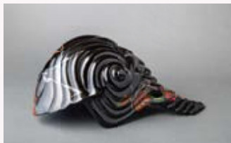
【宇宙の磁場には、キノコが育つ】

1987 東京藝術大学大学院美術研究科漆芸専攻 修了 1988 第8回現代宝飾デザイン展 金賞受賞 1993 サントリー美術館大賞展 1998 NHK「土曜美の朝」に出演 2012 東京藝術大学漆芸 軌跡と未来展 個展、グループ展 国内外で多数開催 〈作品収蔵〉草月美術館、サントリー美術館、国際交流基金