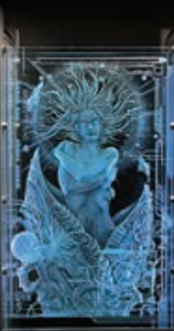
「ABSOLUTO KIND」 長谷川 秀樹