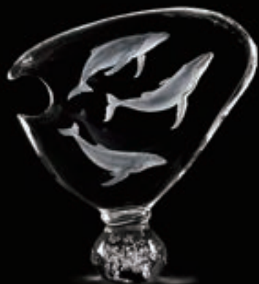
「オーシャンズ ザトウクジラ」 長谷川 秀樹