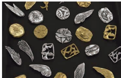
「アクセサリー・ブローチ」