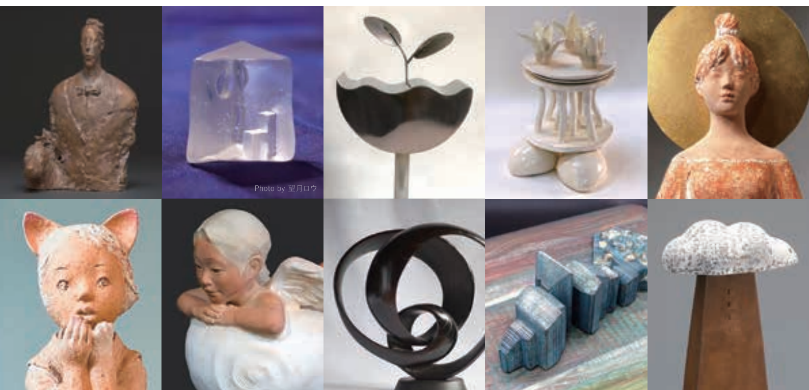
上段左から 池川直「ドーバーの詩人2」/ 奥野美果「Hide and Seek」/ 重田恵美子「TOMORROW-生きる-」/ ひろし高橋「本質的なことって、なに」/ 堀内秀雄「まごころの行方」 下段左から 堀内有子「手袋を買いに」/ 本田正直「雲の上から」/ 前川正治「和(わ)」/ 三田村有純「蒼い刻」/ 山本一樹「All things Wise and Wonderful」