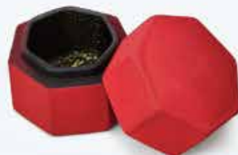
「彼岸過ぎまで」藤田 創平