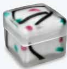
飾箱「ガーデン」藤田 潤