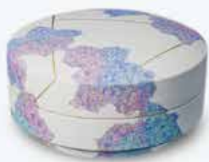
十二単釉彩陶器「耀彩雲」西本 直文