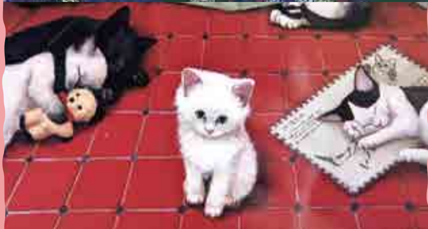
猫の部屋(部分) 石澤晶子