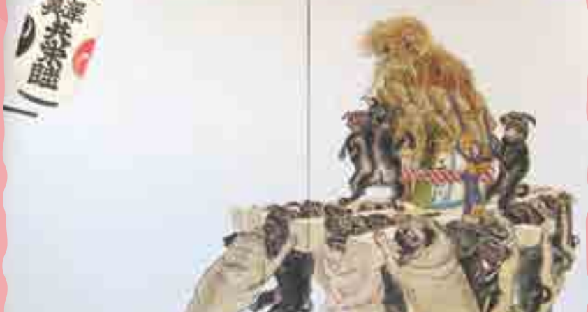
ハク大蛇御輿(部分) 荒井克子