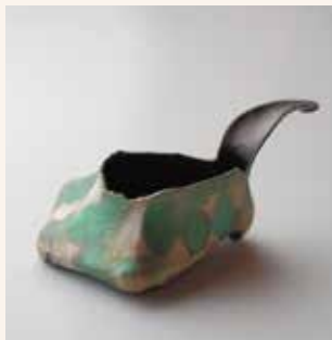
【獣たちにも色を2020 青】 田中 千絵 / 金工 W13cm×D7cm×H6cm