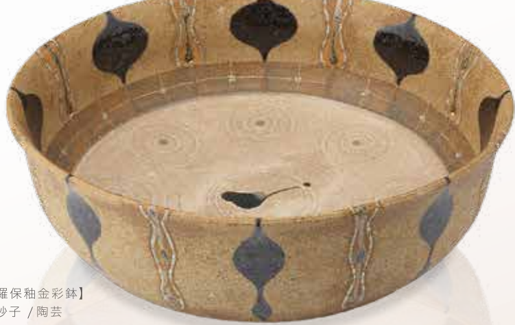
【伊羅保袖金彩鉢】 林 妙子 / 陶芸 φ41cm×H12cm