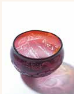
【タコとモンガラカワハギ】 木越 あい / ガラス φ13cm×H7.5cm