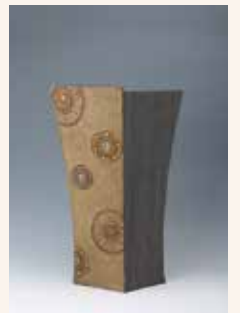
【伊羅保釉金彩花器】 林 妙子 / 陶芸 W34cm×D21cm×H53cm