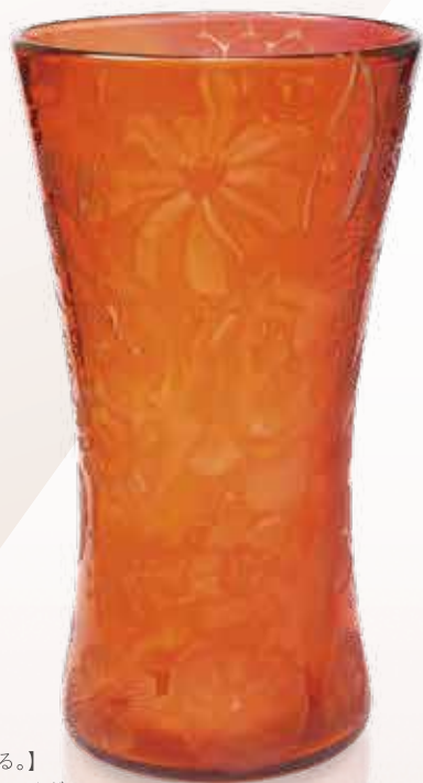
【聴こえる。】 木越 あい / ガラス φ18.5cm×H34cm