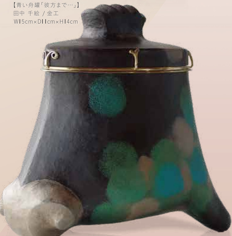
【青い舟罐「彼方まで…」】 田中 千絵 / 金工 W15cm×D11cm×H14cm