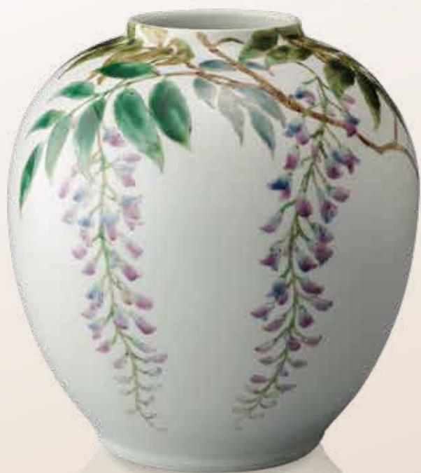
【色絵藤文大壺】 丹澤 裕子 / 陶芸 φ25cm×H27cm