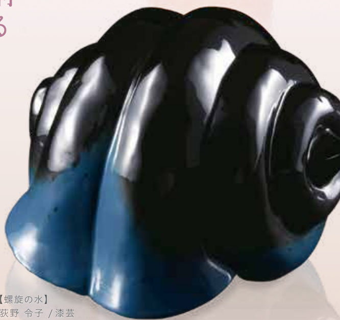
【螺旋の水】 荻野 令子 / 漆芸 W13cm×D12cm×H10cm