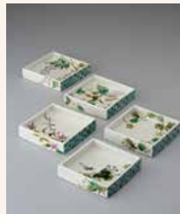
【色絵草花文角組皿】 丹澤 裕子 / 陶芸 W16.5cm×D16.5cm×H3.3cm