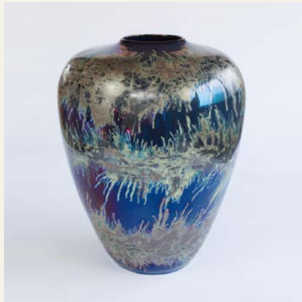
ジョルディセラ 「破線」