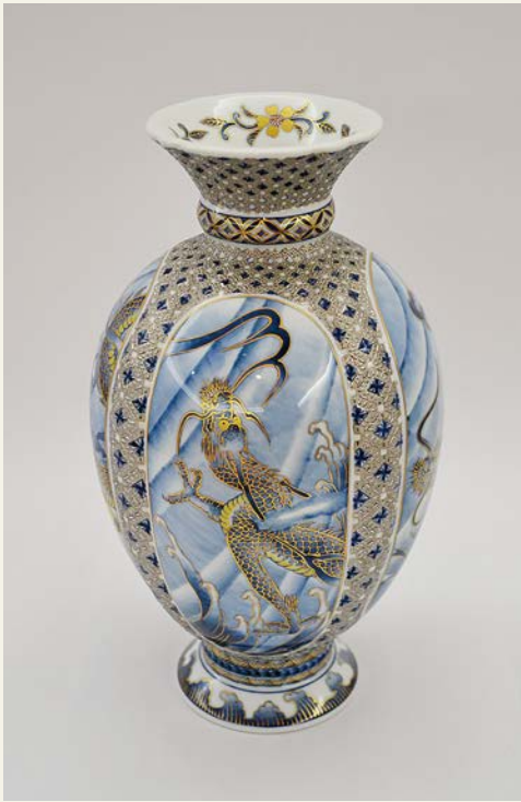
山本一洋 「童子騎龍 飾壺」