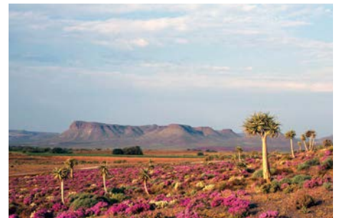
「希少な多肉植物の花園・南アフリカ共和国」