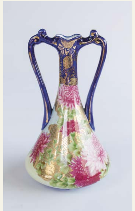
オールドノリタケ 「コバルト金彩花瓶」