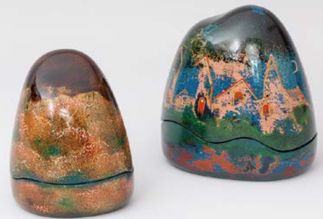
「左：桜・満ちる / 右：夢見る街」