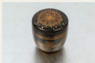
「花盛り」／日本・漆芸