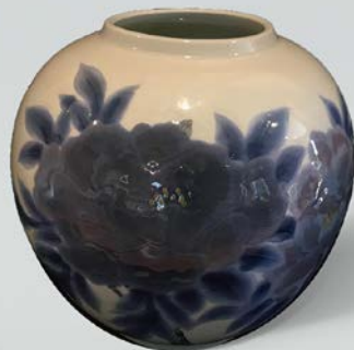
鳥田 文雄/彩磁牡丹文大壺