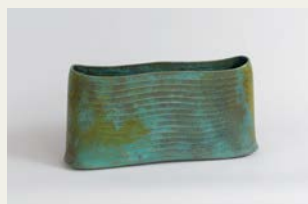
銅器花器「青の譜」／日本・鍍金