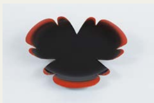
乾漆葉盤「おだまき」／日本・漆芸