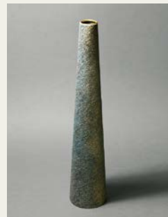
金銀彩銅緑青花器「天」 日本・彫金