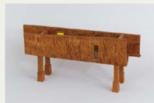
「棟箱」／日本・木工芸

1948年 栃木県生まれ 東京藝術大学名誉教授 中国寧波大学科学技術学院招聘教授