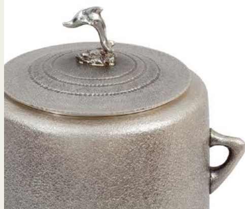
宮田 亮平/イルカ文南鍍水指・部分