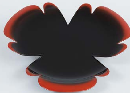
増村 紀一郎/乾漆葉盤「おだまき」