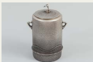
「イルカ文南鍍水指」／日本・鍛金