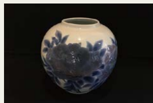
「彩磁牡丹文大壺」／日本・陶芸

1949年 東京都生まれ 東京藝術大学参与・名誉教授 中国閩江学院致道国際漆芸学院名誉院長