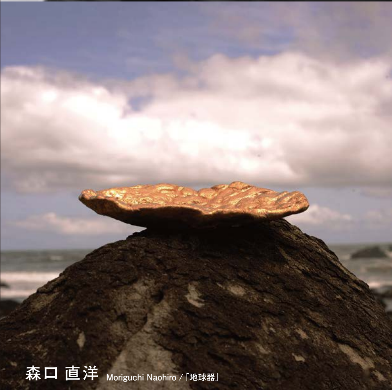
森口 直洋 Moriguchi Naohiro / 「地球器」