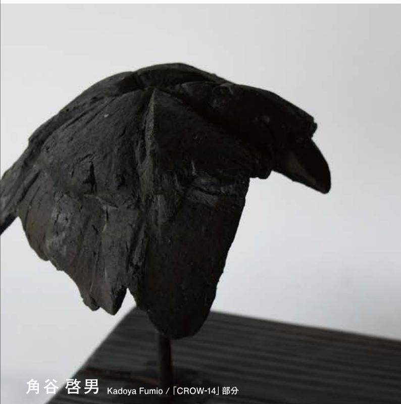
角谷 啓男 Kadoya Fumio / 「CROW-14」部分