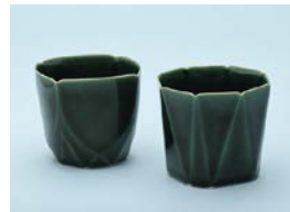
【審査員賞】 米山 タカオ Oribe そば猪口 [四角、八角]