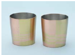
【特別賞(平成記念美術館 ギャラリー)】 松木 光治 / red & yellow