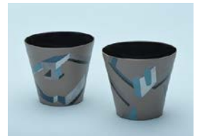
【審査員賞】 劉 秋楊 / 月光城市