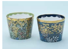
【審査員賞】 各務 有香 / Nouvelle Cuisine