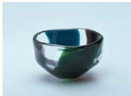
【審査員賞】 塩井 隆晴 / 彩