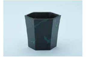
【特別賞(白鷹町文化交流センター あゆーむ)】 野殿 英恵 / たゆたふ