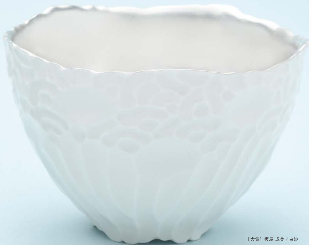
〔大賞〕板屋 成美 / 白妙