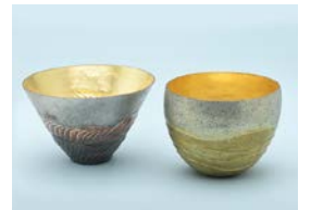
【審査員賞】 サイ ツグハ / 海景色