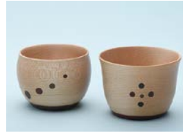
【優秀賞】 松岡 索 / 流れる、とどまる