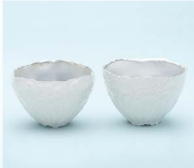
【大賞】 板屋 成美 / 白妙