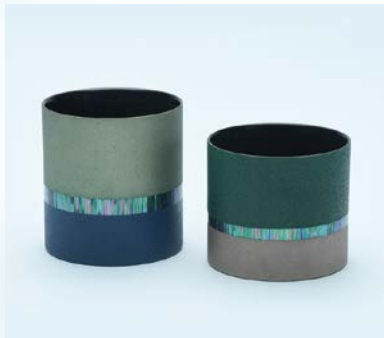
【準大賞】 劉 宇凡 / 痕跡