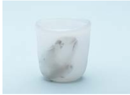
【優秀賞】 塩田 裕未 / Melting ink