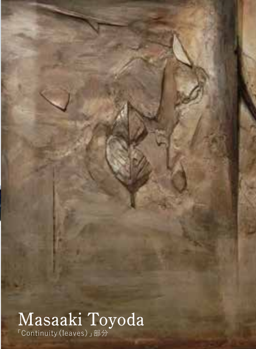
Masaaki Toyoda 「Continuity (leaves)」部分