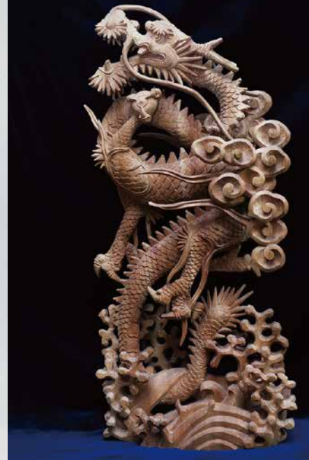
「昇龍」 / 2019年