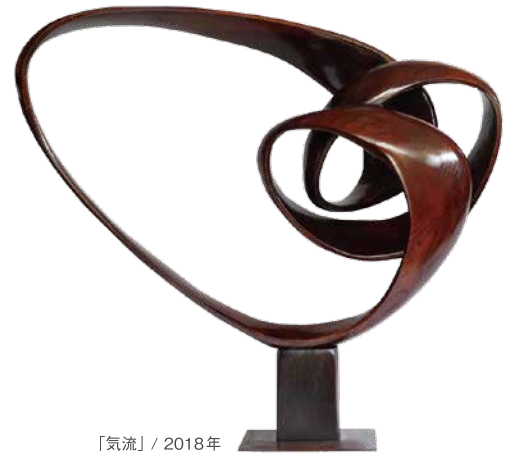
「氣流」 / 2018年