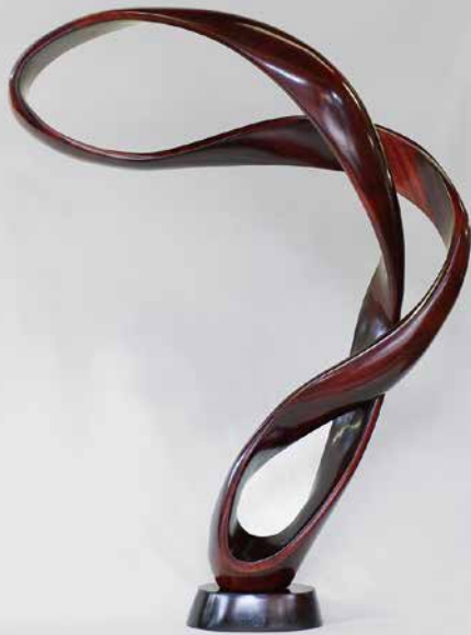
「たおやかに」 / 2013年