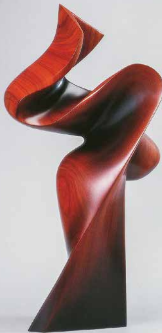
「躍動」第35回 日展 特選 / 2003年