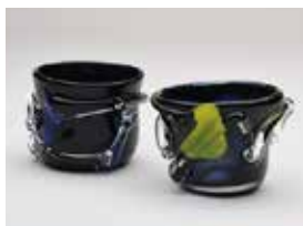
【特別賞 (平成記念美術館 ギャラリー)】 塩井隆晴 / 私69才と妻66才の夫婦そば猪口 (ガラス / 吹きガラス)