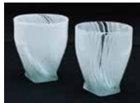
【優秀賞】 保木 詩衣吏 / 雪渓 (ガラス / ホットワーク・キルンワーク・絵付け)