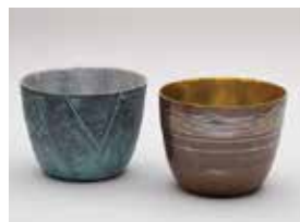
【審査員賞】 サイツグハ / 春めく (鍍金・象嵌 / 銅・銀・金箔)