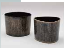
【特別賞 (白鷹町文化交流センター あゆーむ)】 石村 有弓 / 蒔繪 蝶鍔そば猪口「てふてふ」 (漆・麻・銀・錫・貝 / 乾漆・蒔繪・蝶鍔)