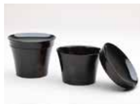
【審査員賞】 泉谷 郁美 / 栃杮そば猪口「月影」 (漆・栃 / 拭き漆)