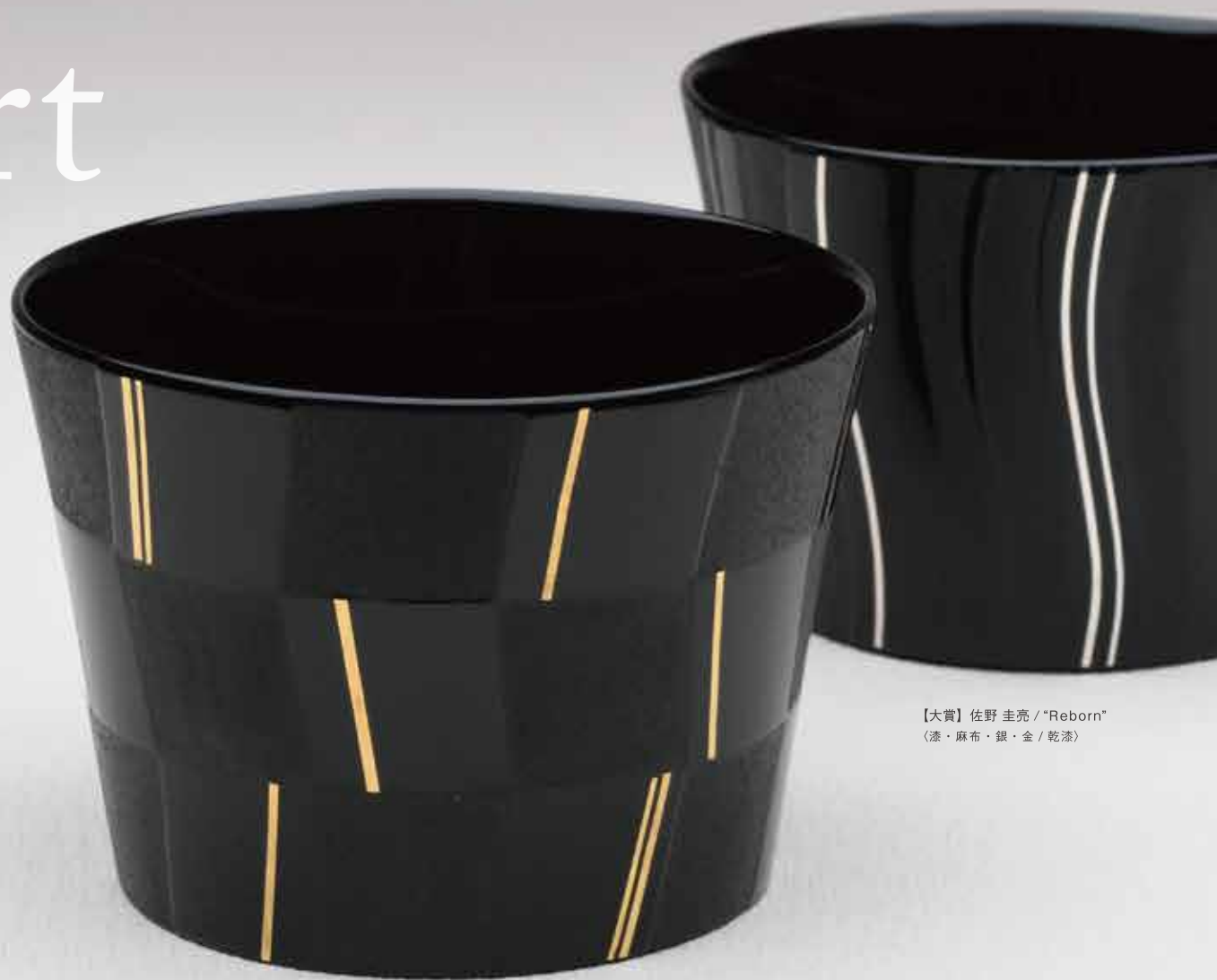
【大賞】佐野 圭亮 / "Reborn" 〈漆・麻布・銀・金 / 乾漆〉