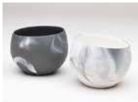
【準大賞】 白井 渚 / 漂霧・朝・夜 (磁 / 錆込み)