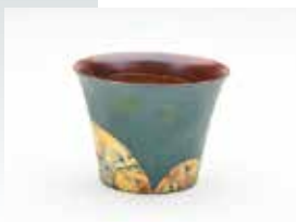
【審査員賞】 金 知瑞 / Tropea Sunset (漆・陶土・金箔・銀箔 / ろくろ・漆焼き付け)