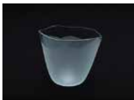
【審査員賞】 黒田 明日美 / みなも (ガラス / キルンワーク・エッチング)