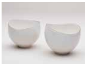
【特別賞 (瀬戸市新世紀工芸館)】 鈴木 由美子 / 光散乱 (陶 / イッチン・金彩)