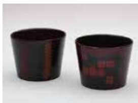
【審査員賞】 黒田 昌吾 / 溜塗そば猪口Ⅰ・Ⅱ (漆・栃 / 溜塗り)