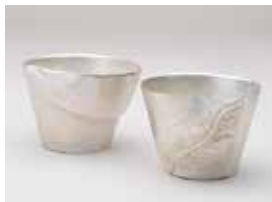
【優秀賞】 大江 絵 / 葉器 (銅 / 鍍金)