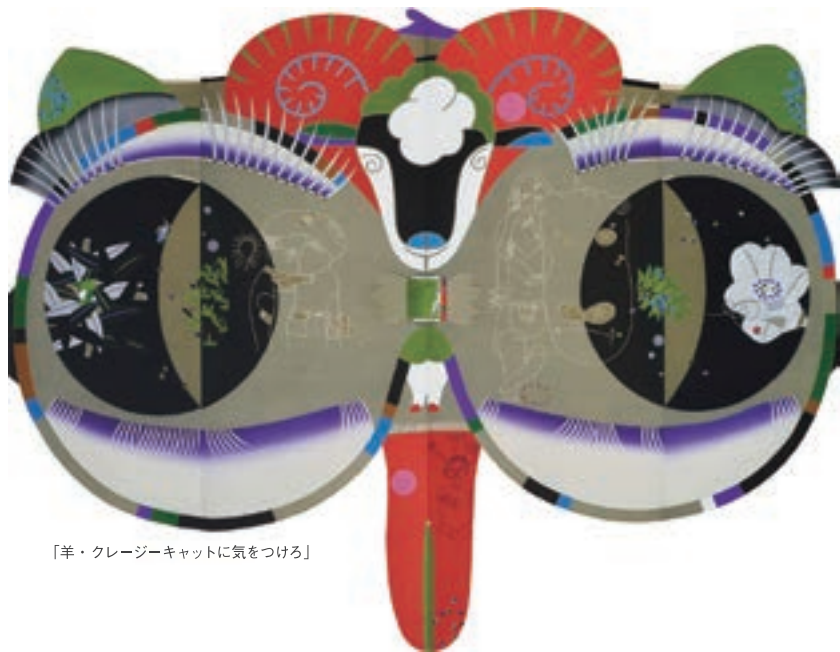
「羊・クレージーキャットに気をつける」