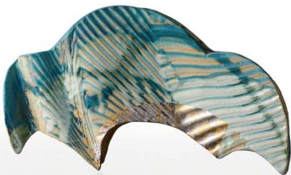
「曇りのち晴れ」 Hayashi Kaku / 陶芸