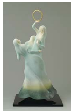
「ニュルンベルグの指環」 Watanabe Yoko / 人形