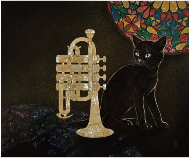
「a little Black Sam」 Takeda Tsukasa / 漆芸