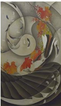
「還」 Takeda Tsukasa / 漆芸