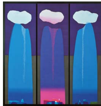
「夜明けの雲」 Hayase Ikue / 染色