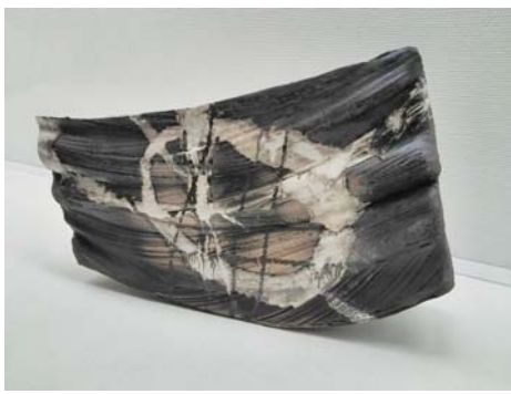
「輪」華厳シリーズ Hayashi Kaku / 陶芸