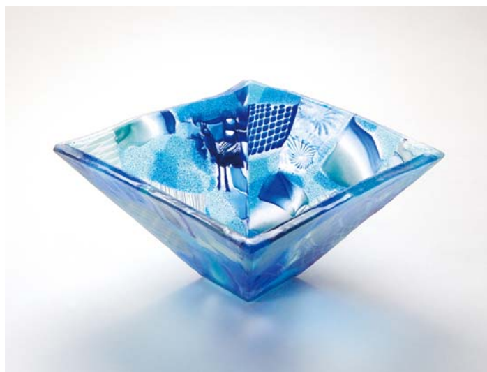
青の風景/神田 正之