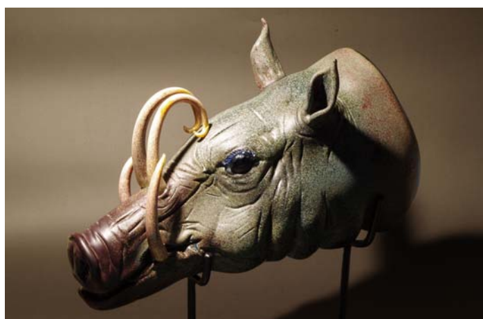
バビルサ/伊藤 けんじ