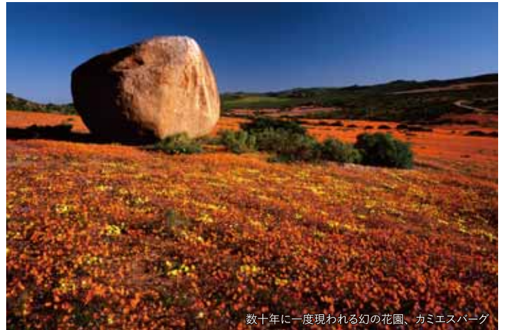
数十年に一度現われる幻の花園、カミエスバーク