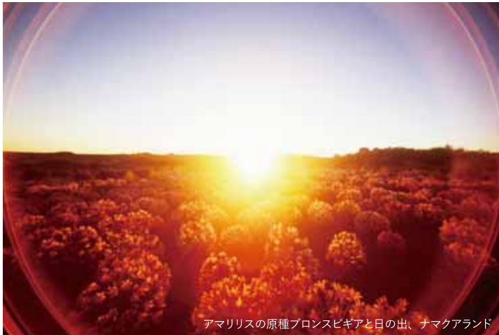
アマリリスの原種ブロンスピギアと日の出、ナマクアランド