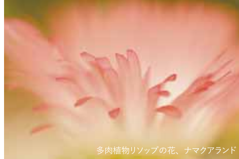
多肉植物リソップの花、ナマクアランド