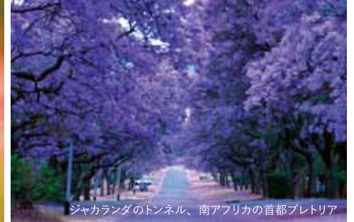
ジャカラダのトンネル、南アフリカの首都プレトリア