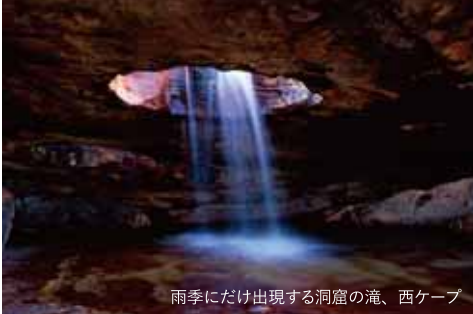
雨季にだけ出現する洞窟の滝、西ケープ