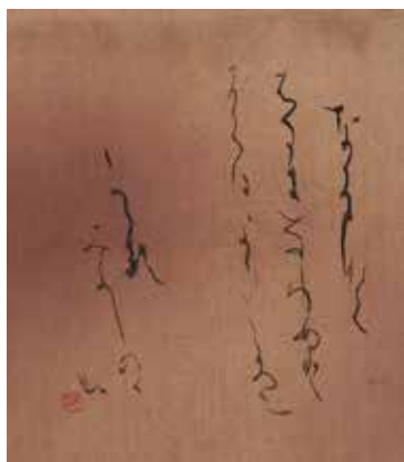
「なにとなく」 何となく春になりぬと聞く日より 心にかかるみ吉野の山