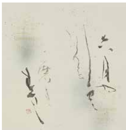
「六月や」 六月や白雲色を磨ぎすまし