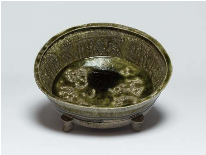
猿投白瓷 獸脚火舎(薫炉) / h12.0cm w32.0cm

陶芸家・大石訓義(おおいしのりよし)は、現在では幻となった猿投古陶研究の第一人者です。使用原料の特定や技法の解明はもとより、時代背景と精神文化の研究も地道に重ね、猿投古陶の再現だけにとどまらず、かつての陶工たちが夢見た青瓷(青磁)の実現にも成功しました。その歴史上の移り変わりを、大石訓義の新作・代表作、約35点によって展示いたします。