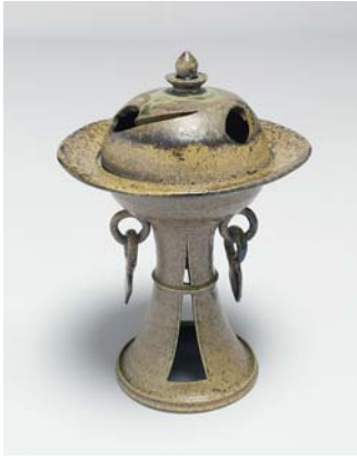
猿投 高坏香炉 / h19.0cm φ12.0cm