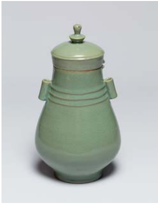
猿投青瓷 唐環耳壺写し / h21.5cm φ17.0cm