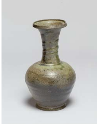
灰釉長頸瓶 / h21.5cm φ12.5cm