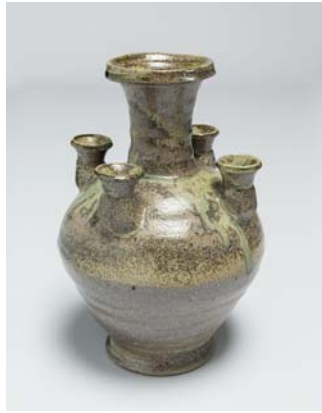
猿投 多口瓶 / h23.5cm φ12.5cm