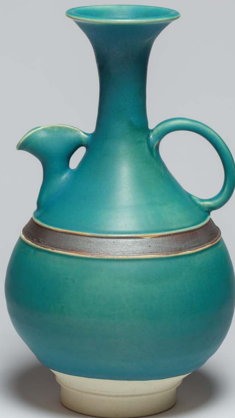
「ベルシャ 青釉取手付水注」